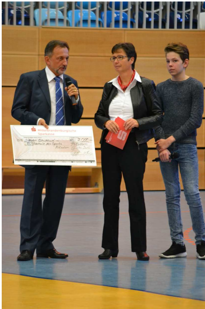
Zudem erhielt die Sportschule Potsdam einen Förderscheck über 7.000 Euro von der Sparkasse.